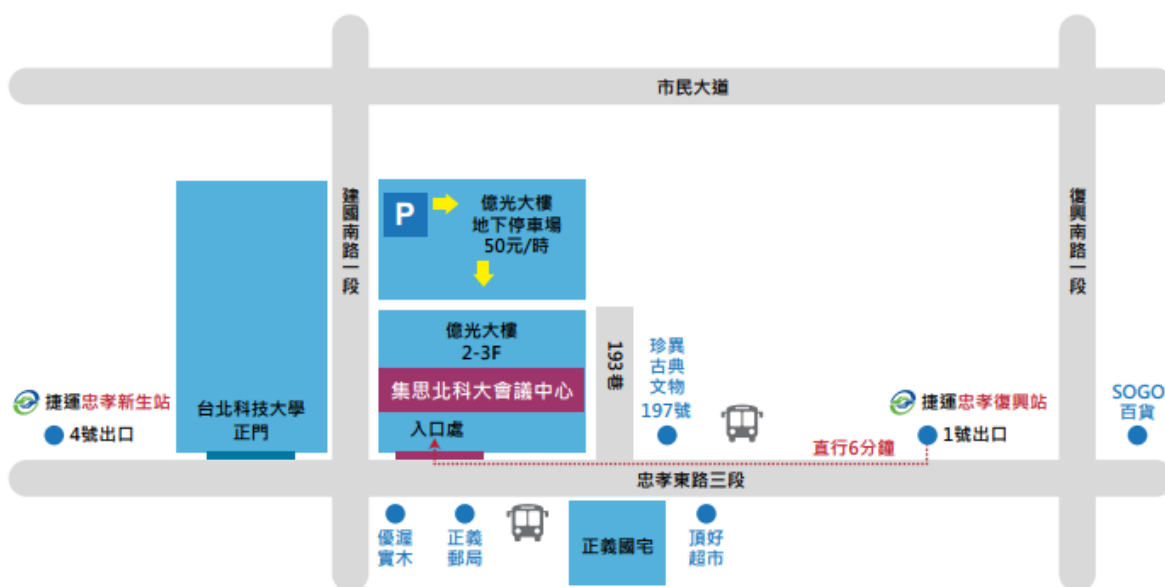
圖 1 集思北科大會議中心位置示意圖