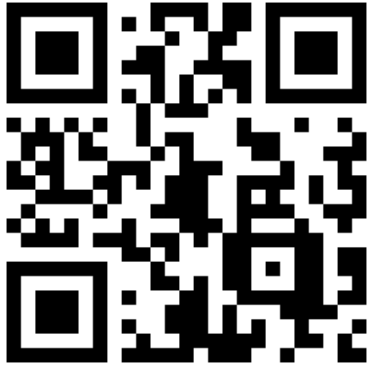
報名表單 Qr Code