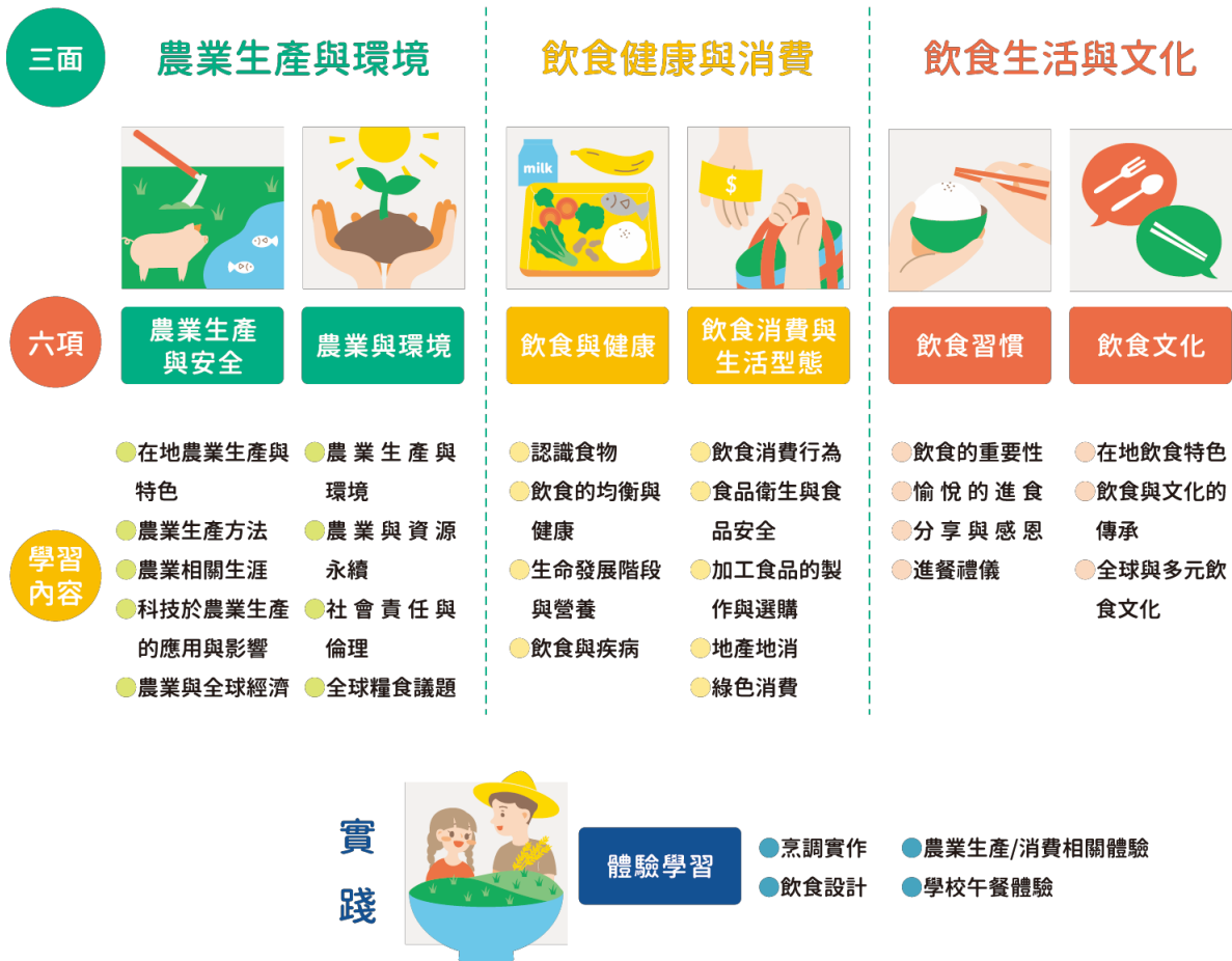
圖 1 食農教育 ABC 模式：食農教育三面六項

資料來源：林如萍，食農教育之推展策略（一）：學校教育實施之概念架構分析，106 年度國立臺灣師範大學產學合作計畫研究報告，頁 28。