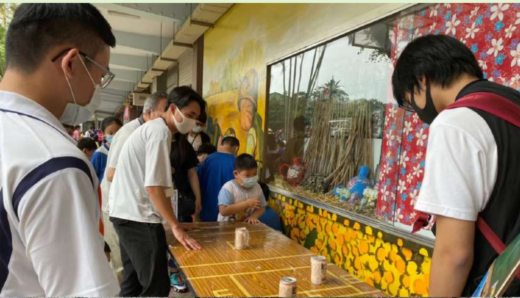
◀ 景觀設計課程中，同學們設計遊戲和國小學生互動。

課程中另外一組的學生，在當地環境中發現了水污染的問題。並在討論後認為水污染應該從根本解決，但這項議題卻超乎他們想像的巨大。雖然無法立即處理污染問題，但學生們也提出了「製作環境教育材料」這項想法，利用拍影片和製作繪本的方式為當地孩童建立正確的保育水資源觀念，提高他們的環保自覺性。這兩則故事都讓我們看見了地景建築系學生在這堂課程中的行動力以及克服問題的過程，正因為重視所觀察的環境，才能想出實際且有效的改善方案。