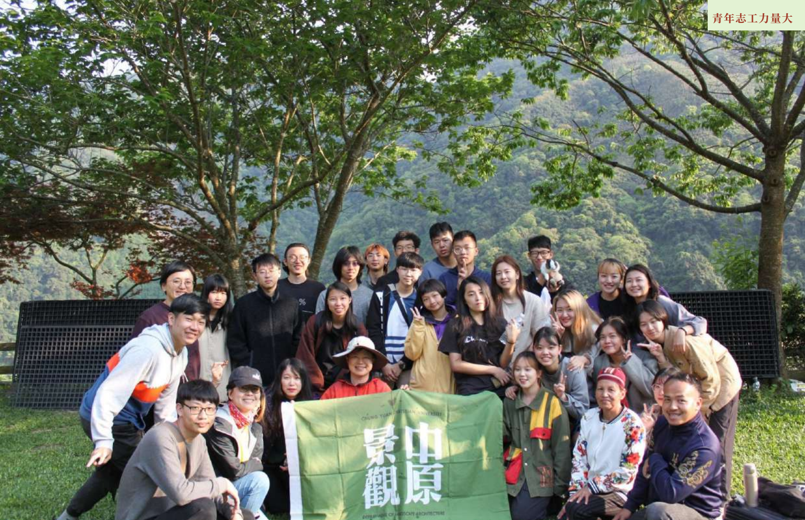
▲ 環境體驗實習課程中，在卡維蘭部落的大合照。

老師還分享了另一則暖心的小故事，在地景建築系中，有一場連續八到九天的「下鄉」活動，它結合了「環境體驗」、「環境調查實習」以及「景觀設計」等三項課程，會至三到四個聚落同時舉行。活動的內容非常特別，住宿方式是要在當地人的家中借宿，如果是以露營的方式則是要自己去紮營和煮飯。這對學生來說無疑是一個跳出舒適圈的挑戰。而在去年的活動中，有一位憂鬱症的學生在最後一天的營火晚會時，分享了自己這幾天的轉變。在面對各種困難和挑戰的宿營下，他自己除了在本身對外的交流能力上有了成長，對自己的瞭解也變得比以往清晰許多。甚至他在活動後的幾天即使停止服藥，還是可以控制自我的情緒，對外和對內有了雙向的療癒，帶給他自己和周遭的人們一個暖心的回饋。服務往往不單純只有被服務者受到幫助， 做服務就像是朝著他人噴香水，自己也會沾上一兩滴。