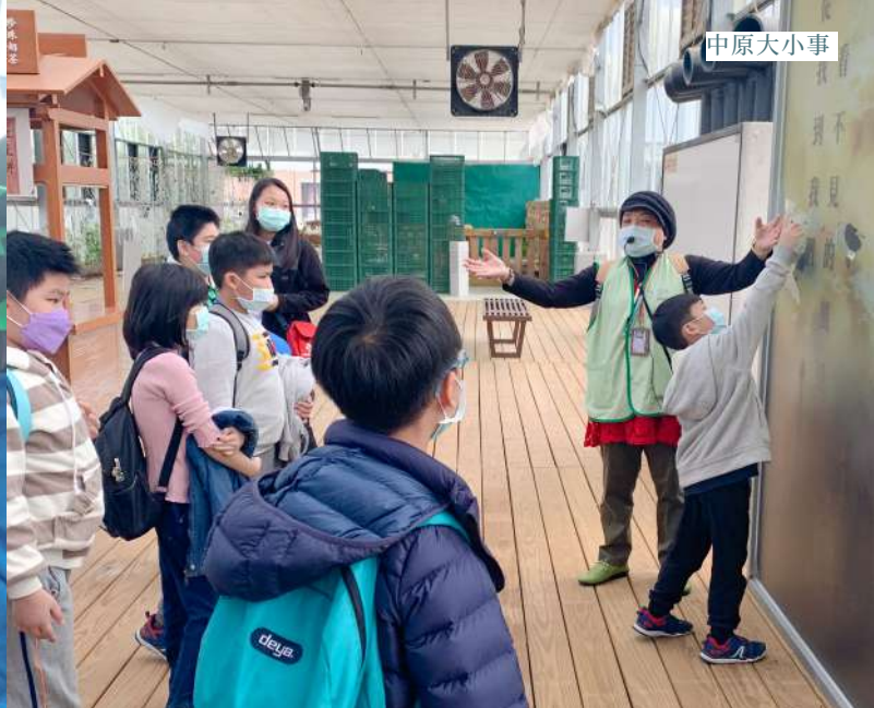
▲ 新二代孩童專心聆聽環保概念的解說。