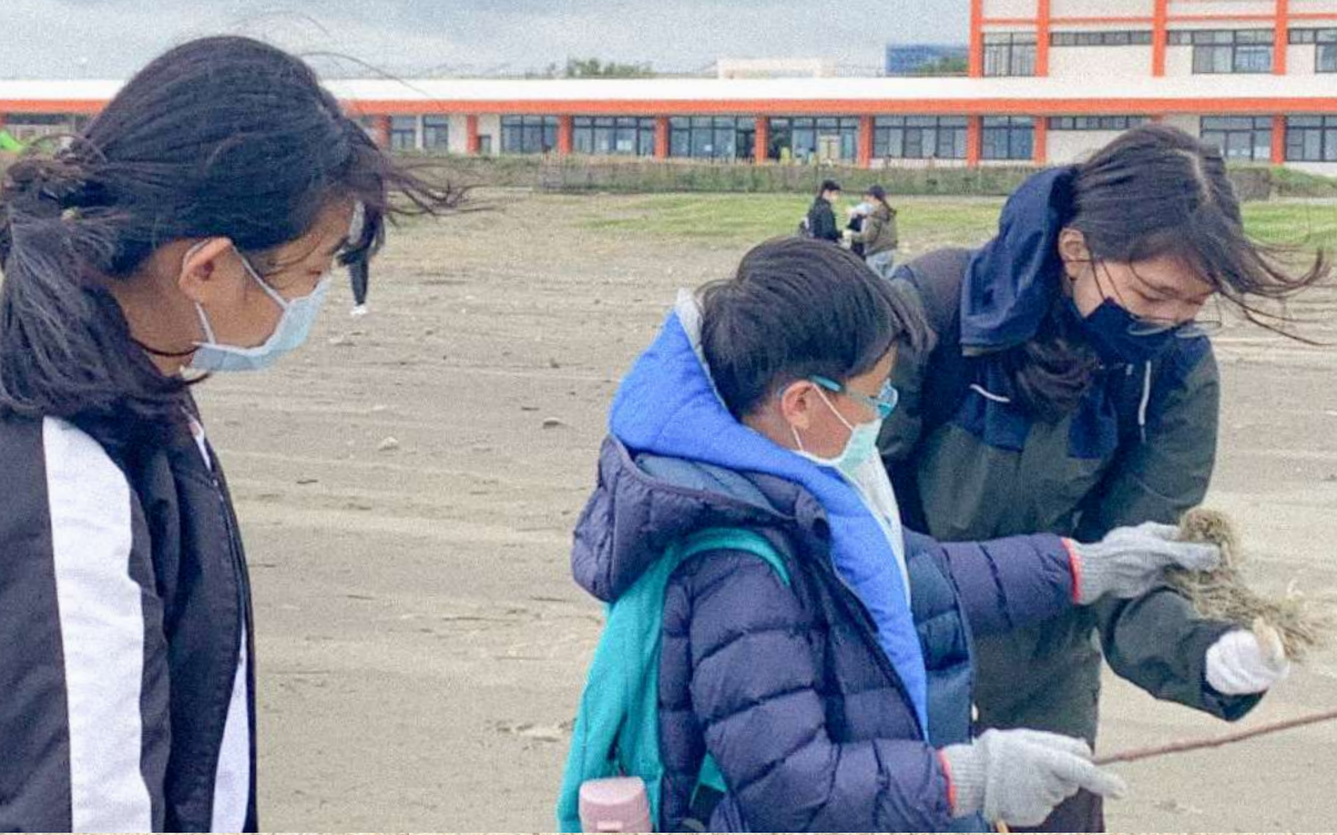
▲ 青年志工與孩童一同拾起海灘上的垃圾。