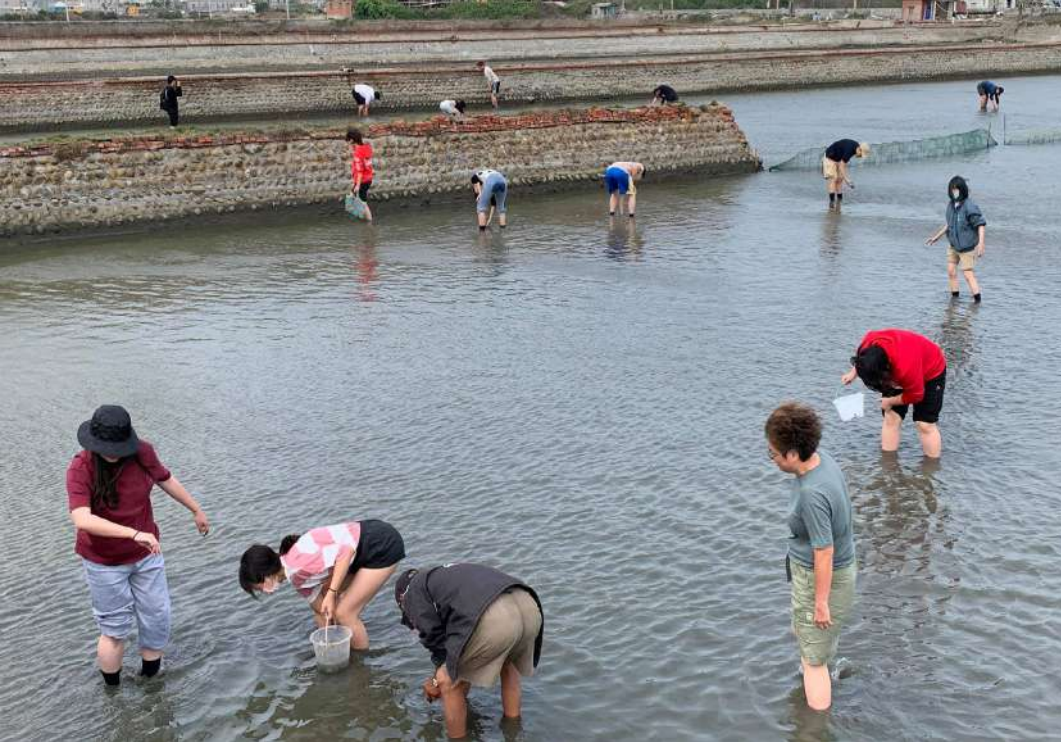
◀ 環境調查實習中，同學們下水體驗漁民撿拾蛤蜊的辛苦。