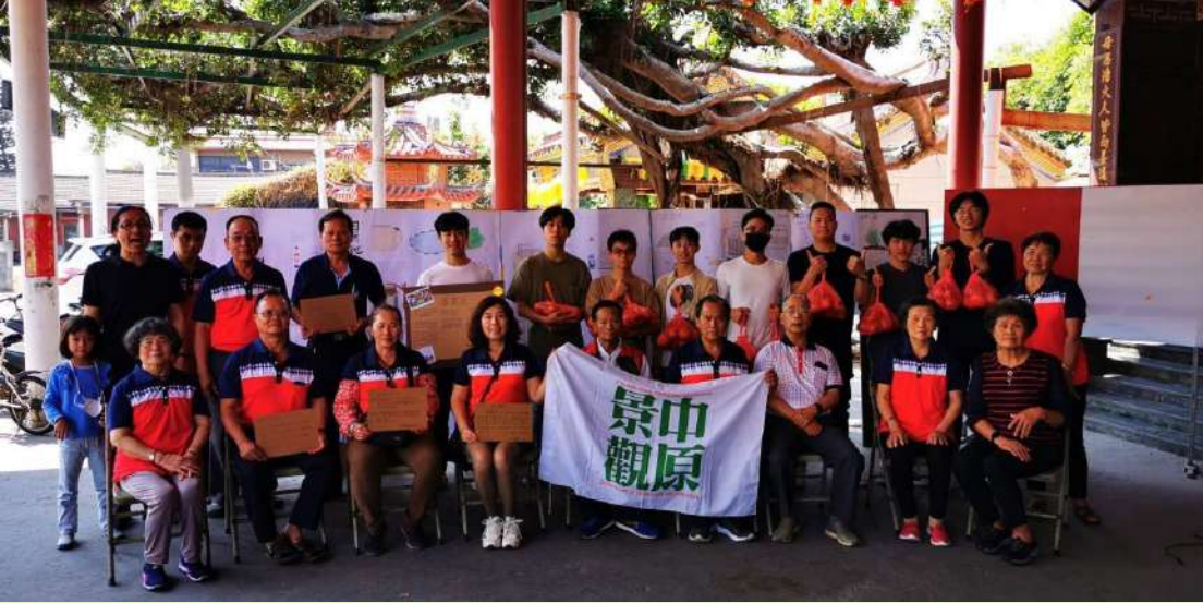
◀ 環境調查實習課程中的服務大合照。