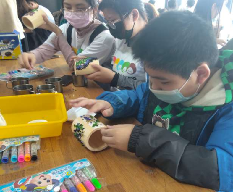
▲ 新二代孩童以海洋廢棄物再製成的玻璃砂裝飾筆筒。