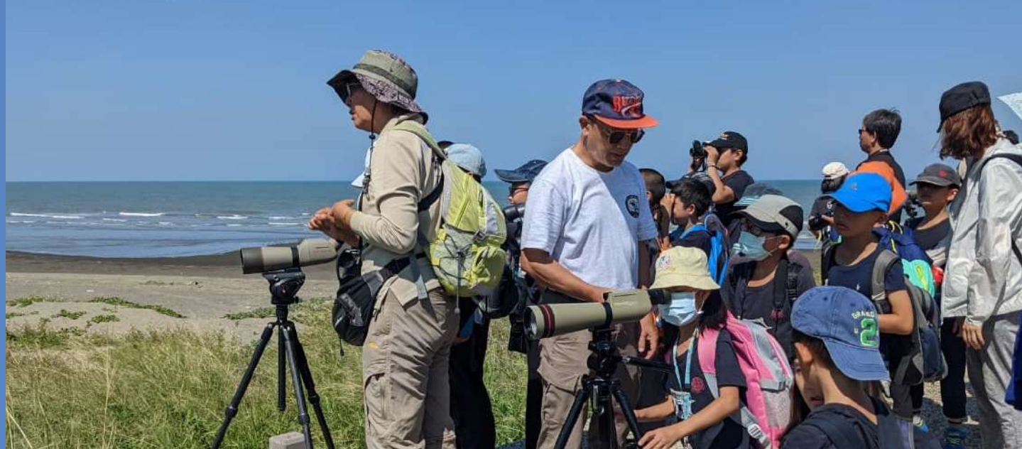
▶ 學會成員帶領小朋友認識環境與鳥類。

細微的雪花片片墜落，積累成座座高聳的雪山。然而，這看似微小的雪花卻可能是雪山崩塌的影響者。平日我們認為的一個再微小不過的舉動，像是將釣魚線、垃圾棄於環境中，可能是因為便利性亦或是習慣，卻因此破壞了當地的環境，也迫害了當地生態及動物的生存。在我們生活的地區—桃園，社團法人桃園市野鳥學會正以持續推廣生態保育及環境教育觀念為宗旨，致力於傳遞學會理念，讓更多人瞭解人與生態、環境的關聯性，也讓民眾意識到平時一個不經意的行動皆有可能影響了生態系統！除此之外，學會平時也辦理各種生態講習、野生動物救護站、非營利野生動物診所以及賞鳥行程等服務項目，號召擁有共同目標的夥伴們一起努力，從中締結了良好的循環。